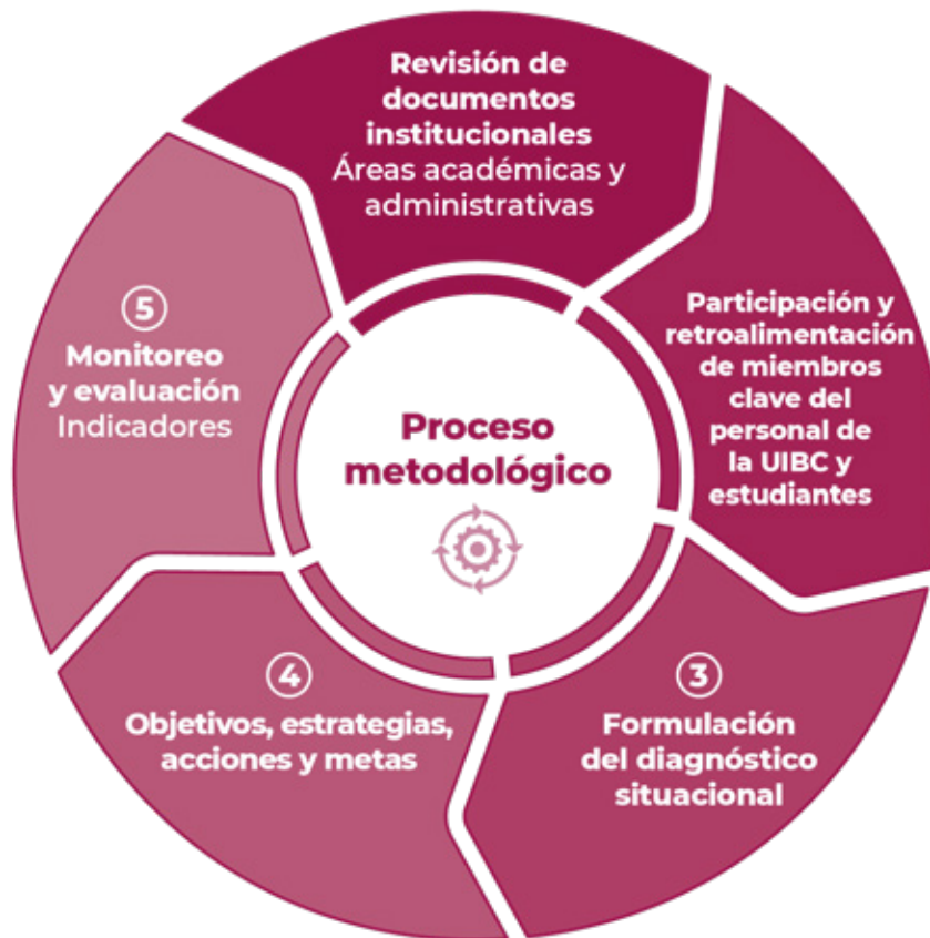
Esquema 1. Etapas del proceso de formulación del PID 2023-2027

Fuente: Elaboración de Coplade con datos proporcionados por la UIBC.