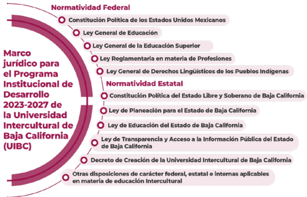
Figura 2. Marco jurídico para el Programa Institucional de Desarrollo (PID) 2023-2027

Fuente: Elaboración de Coplade con datos proporcionados por la UIBC.