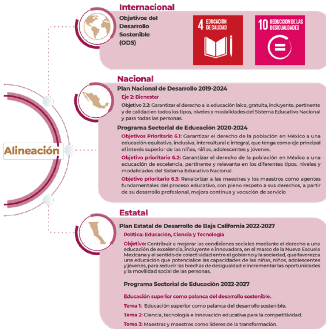
Figura 1. Alineación del Programa Institucional de Desarrollo (PID) 2023-2027

Fuente: Elaboración de Coplade con datos proporcionados por la UIBC.