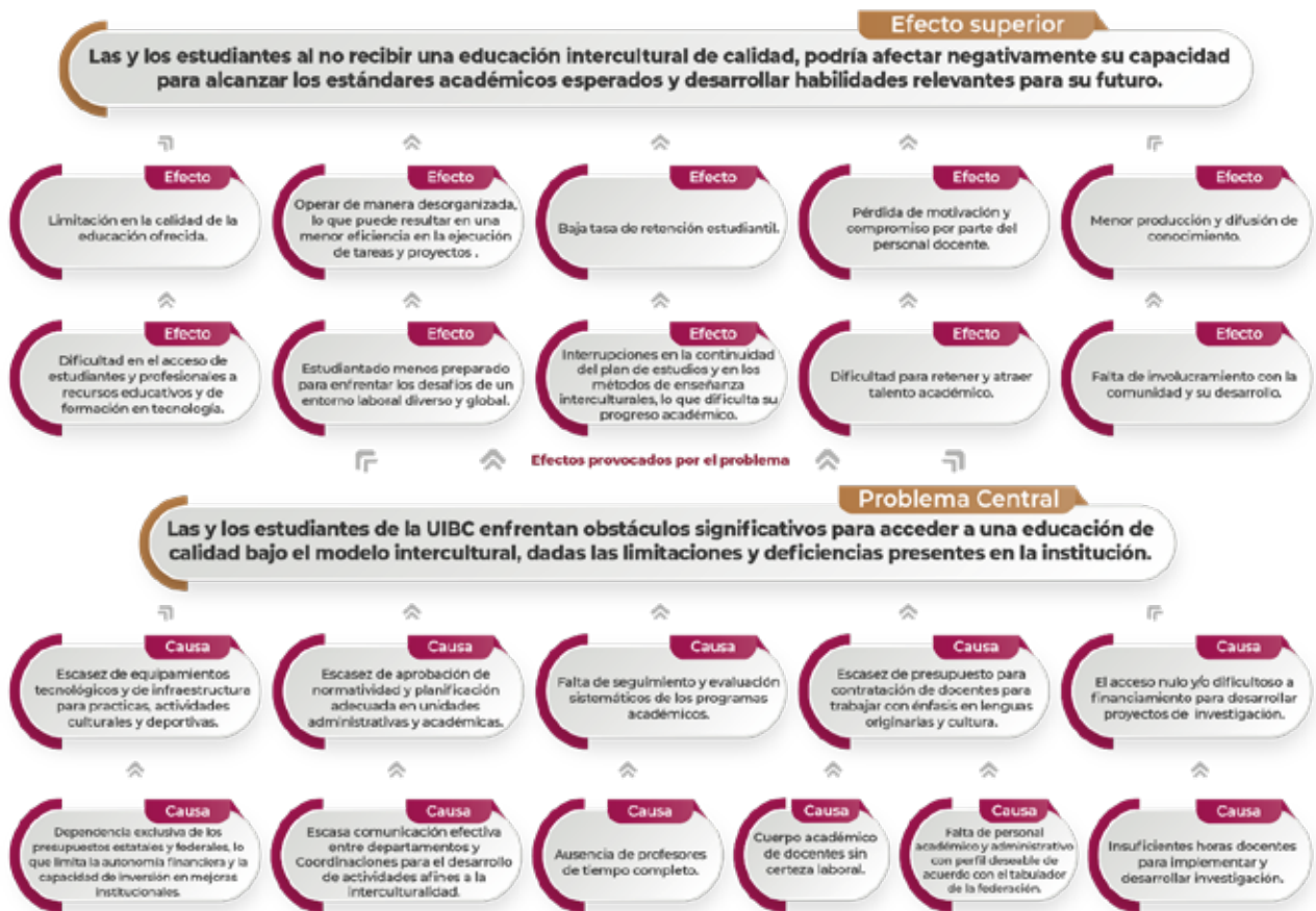
Esquema 2. Árbol de problemas